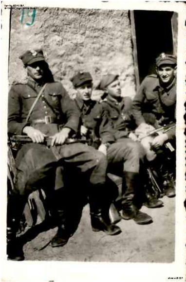
Pierwszy od lewej por. „Stefan”, Podlasie 1945 r.

znana z wcześniejszych przywołań. Nowością jest informacja o okolicach Ełku jako miejscu, gdzie na przełomie 1945 i 1946 r. miał „zamelinować” się por. „Stefan”. Jest to szczegół, który uważam za niezwykle ważny przy próbie identyfikacji tego oficera. Natomiast „Regina” błędnie określiła wiek „Stefana”, czyniąc go rówieśnikiem „Łupaszki” (ur. 1910 r.), czemu przeczy zdecydowana większość zachowanych źródeł, w tym zachowanych zdjęć, na których widoczny jest adiutant mjr. Szendzielarza.