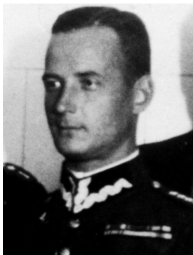
Płk Franciszek Niepokólczycki - fotografia przedwojenna z akt gestapo w Łodzi.

Franciszek Niepokólczycki urodził się w 1901 r. w Żytomierzu – dzisiaj znajdującym się na Ukrainie. Na początku XX w. był to ważny ośrodek polskości na Kijowszczyźnie, ale w konsekwencji pokoju ryskiego pozostał po stronie bolszewickiej. Znaczna część tamtejszych Polaków uległa zagładzie lub wynarodowieniu w Związku Sowieckim.