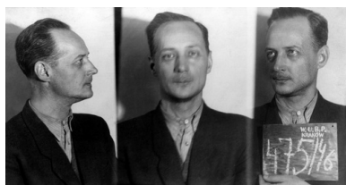
Franciszek Niepokólczycki, zdjęcia sygnalityczne z akt UB, 30 listopada 1946 r.

Chociaż prezes II Zarządu Głównego WiN odmówił wystosowania prośby o łaskę, jemu i czterem innym skazanym Bolesław Bierut złagodził orzeczoną karę. Niepokólczyckiemu karę śmierci zamieniono na dożywotnie więzienie.