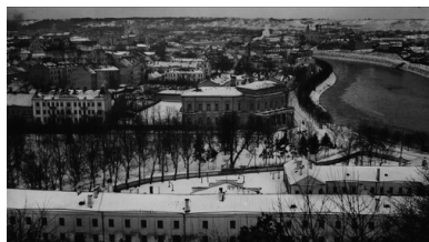
Panorama Wilna. Widok z Góry Zamkowej w kierunku Starego Miasta i Śnipiszek. Na pierwszym planie koszary 3. Pułku Saperów, centralnie Biblioteka im. Wróblewskich (dawny pałac Tyszkiewiczów). Z prawej widoczna rzeka Wilia. Druga Rzeczpospolita.