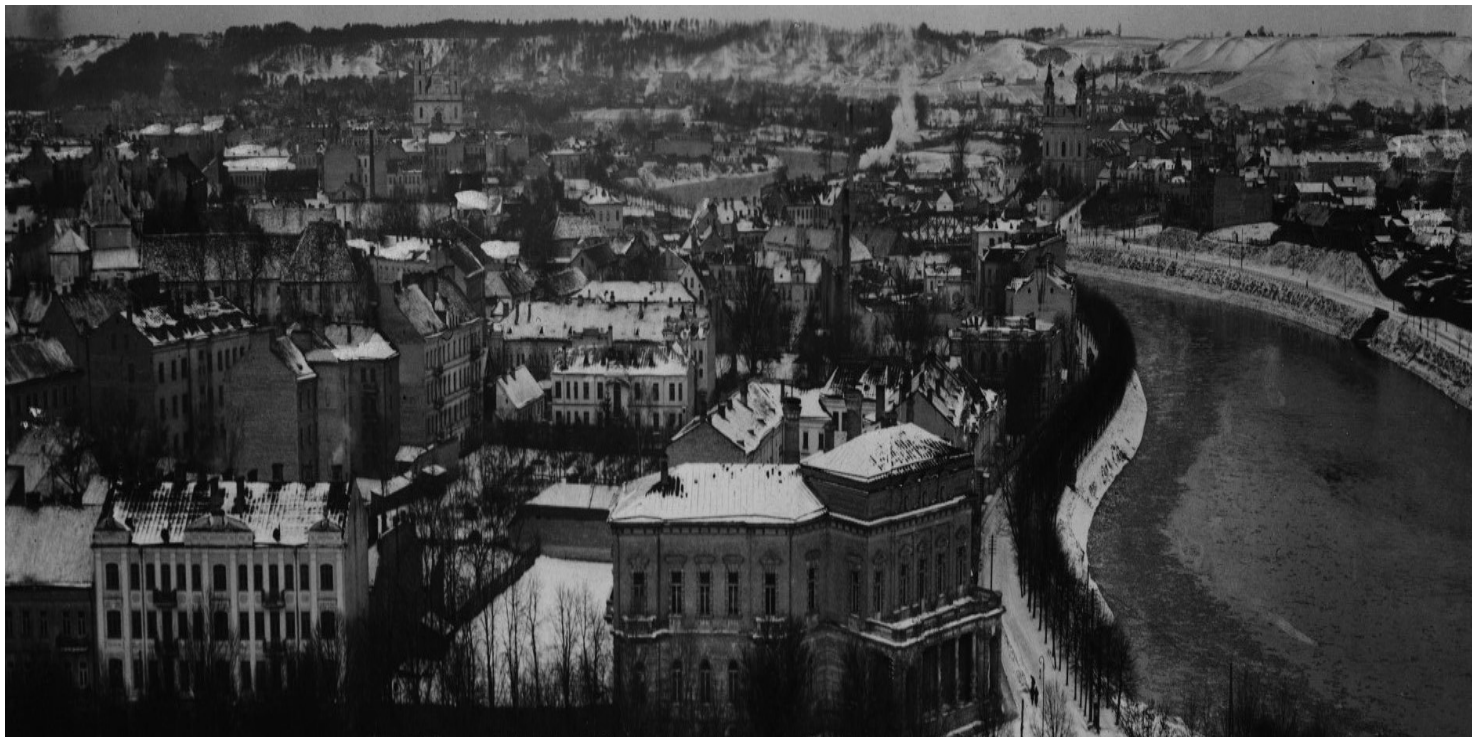
Panorama Wilna.

https://przystanekhistoria.pl/pa2/tematy/podziemie-antykomunisty/69465,Obowiazek-wobec-Polski.html