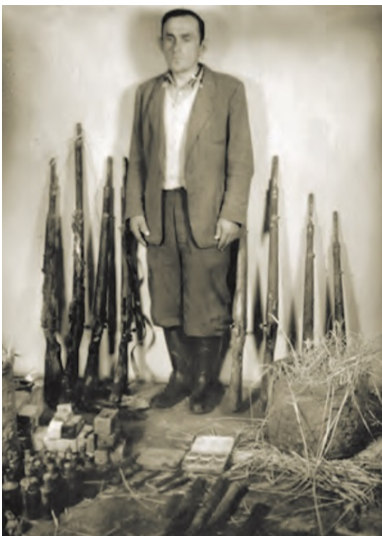
„Wróg ludu” i jedna z odnalezionych przez UB skrytek dokumentów i broni Inspektoratu AK Miechów.

I tak na przykład komórki legalizacyjne miały przygotowywać dokumenty pozwalające na bezpieczne wyjazdy zagrożonych aresztowaniem AK-owców na inny teren; niszczone miały być listy poborowych. Wskazywano też na konieczność zabezpieczenia broni, wystrzegania się używania nazwy rozwiązanej formalnie AK, podkreślano znaczenie przekazywanej z ust do ust propagandy antykomunistycznej.