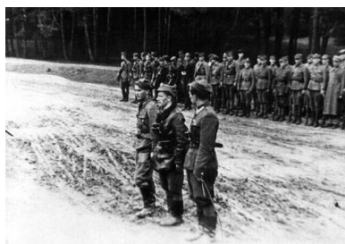
Żołnierze oddziałów Inspektoratu „Hanka” NZW oraz dezercerzy z