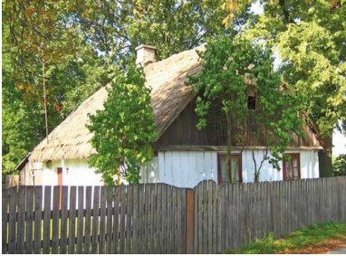
Dom rodzinny Bąków, obecnie już nieistniejący, widok z 2008 r.

z kolektywizacji wsi, działalności partii komunistycznej, zagrożeniach, jakie niesie ze sobą dla państwa nowy ustrój. Zbierano również dane o członkach PZPR na obszarach działania OK PSL, a więc w powiecie grójeckim, a później także w Warszawie.