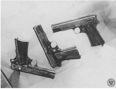
Broń i...