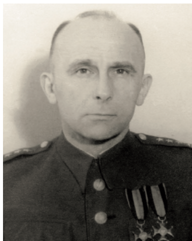
Pułkownik Jan Rzepecki

W odezwie Rzepeckiego była również mowa o „zwyrodnieniu życia leśnego” (jakby w okresie okupacji niemieckiej nie było zjawisk patologicznych w podziemiu), a także o szkodliwości wystąpień grup zbrojnych „spod znaku istotnej reakcji społecznej”. W dokumencie tym Rzepecki potępiał akcje zbrojne skierowane przeciwko okupacyjnym wojskom sowieckim i funkcjonariuszom aparatu bezpieczeństwa – a przypomnijmy, że czynił to w momencie, w którym trwały masowe represje sowieckie, takie jak ludobójcza obława augustowska, w wyniku której aresztowano ponad 7 tys. ludzi, a co najmniej 562 zamordowano.