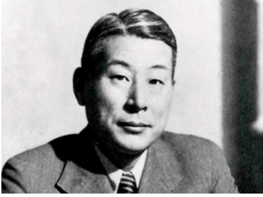
Chiune Sugihara (1900-1986)

W 1985 r. przyznano mu odznaczenie Yad Vashem.