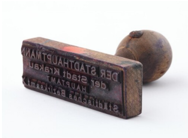
Pieczętka niemieckiego starosty miasta Krakowa używana przez PPS do fałszowania dokumentów, 1939-1944 r.