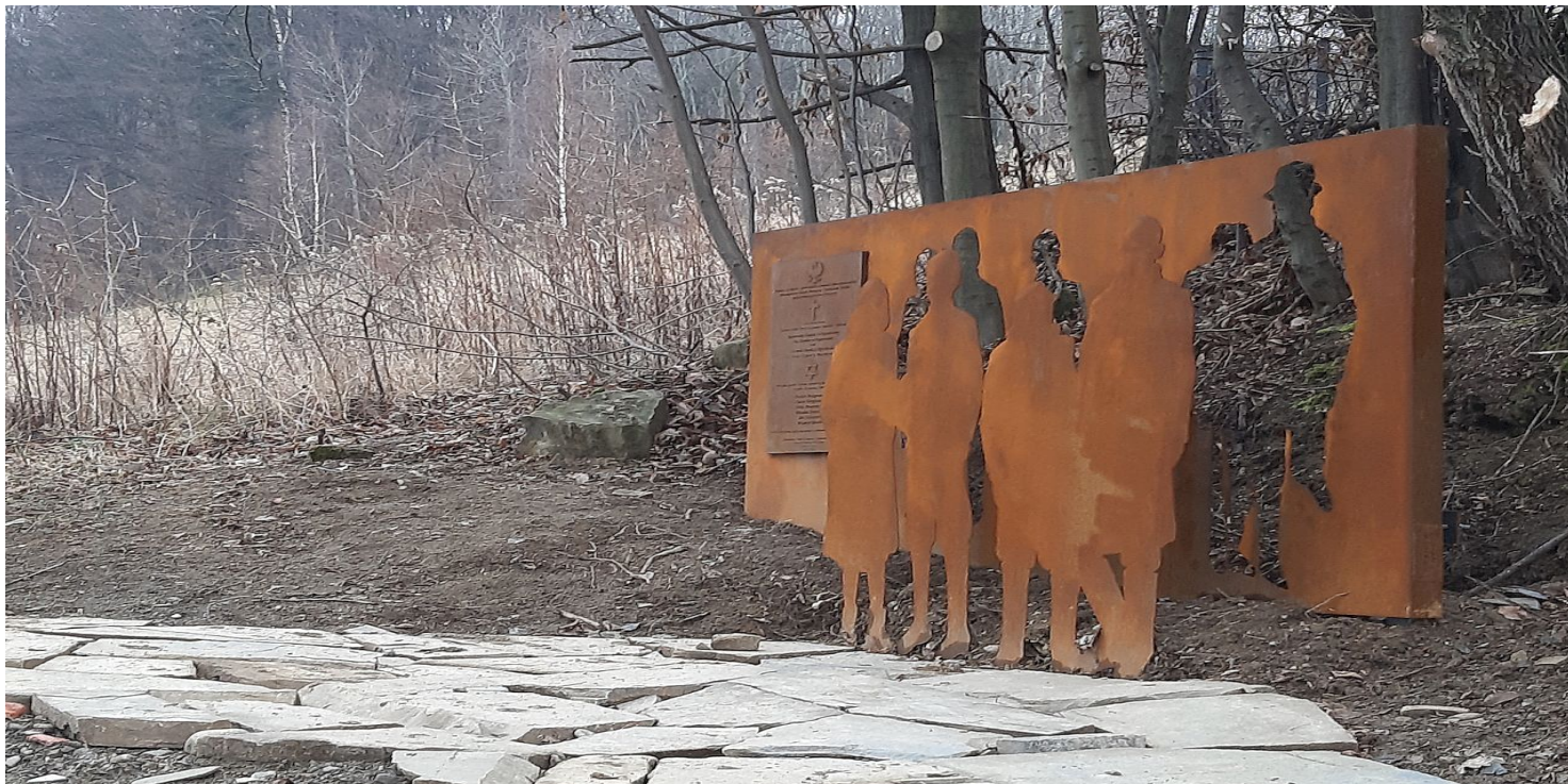
Pomnik w Popardowej.

https://przystanekhistoria.pl/pa2/tematy/polacy-ratujacy-zydow/79924,Ruminowie-Borek-i-Tokarz-zamordowani-i-za-pomoc-Zydom-na-Sadeczczyźnie.html