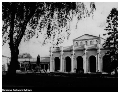
Park Zdrojowy w Busku-Zdroju, 1943 r.