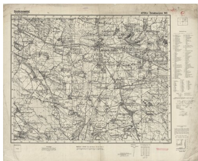
Niemiecka mapa okolic Buska-Zdroju

Według badań prowadzonych w ramach projektu Instytutu Pamięci Narodowej pt. „Terror okupacyjny na ziemiach polskich w latach 1939-195”, autorka niniejszego artykułu ustaliła nazwiska co najmniej 8344 Żydów z terytorium Kreishauptmannschaft Busko, którzy ponieśli śmierć w czasie II wojny światowej. Przeważająca większość z nich zginęła w niemieckich nazistowskich obozach zagłady: w Treblince, w Bełżcu, czy też w KL Auschwitz-Birkenau.