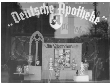
Okupowany przez Niemców Kraków, 1940. Witryna niemieckiej apteki przy pl. Dominikańskim.