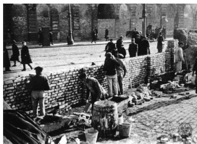
Budowa murów getta w Warszawie, 1940. Wylot ul. Grzybowskiej na ul. Graniczną - widok z terenu getta

Kwestia odpowiedzialności karnej za pomoc Żydom na terenach wcielonych do Rzeszy wymaga jednak nadal szczegółowych badań. Podobnie jak i na opisywanych wcześniej terenach wschodnich.