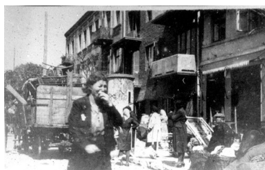
Wysiedlanie kutnowskich Żydów do getta, 16 czerwca 1940 r. Fot.

Kara śmierci za udzielanie pomocy Żydom, zgodnie z trzecim rozporządzeniem z 15 października 1941 r. o ograniczeniu pobytu w Generalnym Gubernatorstwie, obowiązywała na terenie pięciu dystryktów Generalnego Gubernatorstwa. Tutaj też, najprawdopodobniej, była ona najczęściej wykonywana. Taką samą karę zarządził na terenie Reichskommissariat Ukraine i Reichskommissariat Ost (Wołyń, Polesie, Nowogródzczyzna, wschodnia Białostoczyzna, Wileńszczyzna), choć tam najprawdopodobniej nie wydano aktu prawnego, porównywalnego z tym w GG. Na chwilę obecną nie są znane dokładne daty takich rozporządzeń.