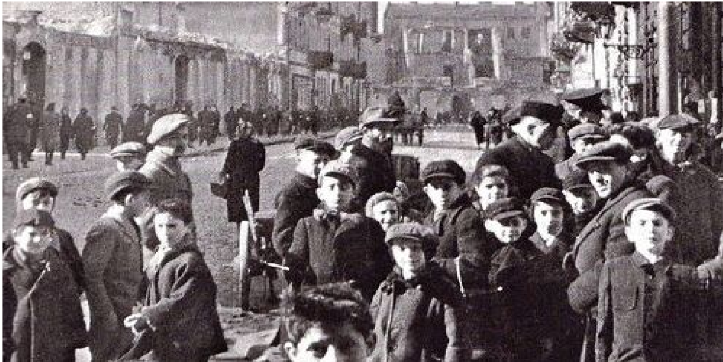
Dzieci w getcie warszawskim

https://przystanekhistoria.pl/pa2/tematy/polacy-ratujacy-zydow/97093,Pomoc-Zydom-karana-smiercia-Zarys-niemieckich-przepisow-okupacyjnych-na-obszarze.html