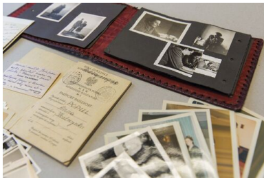
Dokumenty osobiste Anny Poray-Wybranowskiej.