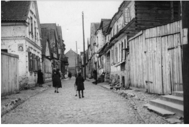
Białystok, ulica w dzielnicy Chanajki. Okres Drugiej Rzeczypospolitej.

Policja, idąc za ciosem, trzy dni po delegalizacji rady ponownie zwróciła się do Sądu Okręgowego, tym razem z wnioskiem o „zamknięcie” ośmiu najbardziej skomunizowanych związków.