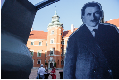
Sylwetka Romana Dmowskiego z wystawy plenerowej IPN „Powstała, by żyć” w 100. rocznicę odzyskania niepodległości