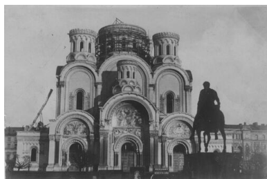
Widok soboru św. Aleksandra