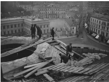
Rozbiórka soboru św. Aleksandra Newskiego, maj 1925 r.