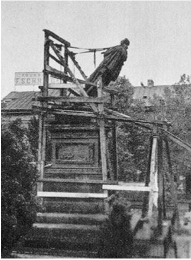
Rozbiórka pomnika Iwana Paskiewicza