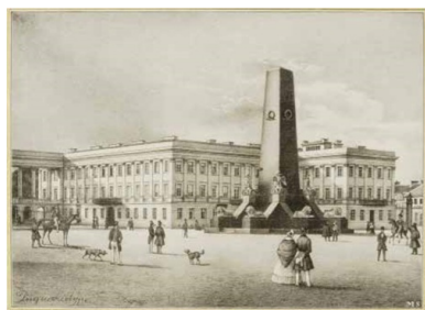
Pomnik Polaków poległych za wierność carowi przed Pałacem Saskim

Przypomniano, jakie kary grożą za niewykonanie poleceń władz okupacyjnych.