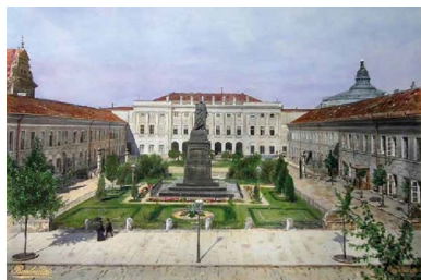
Pomnik Iwana Paskiewicza na dziedzińcu Pałacu