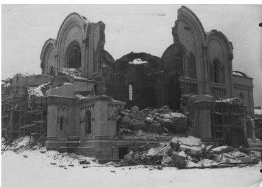
Widok soboru św. Aleksandra Newskiego w trakcie rozbiórki,