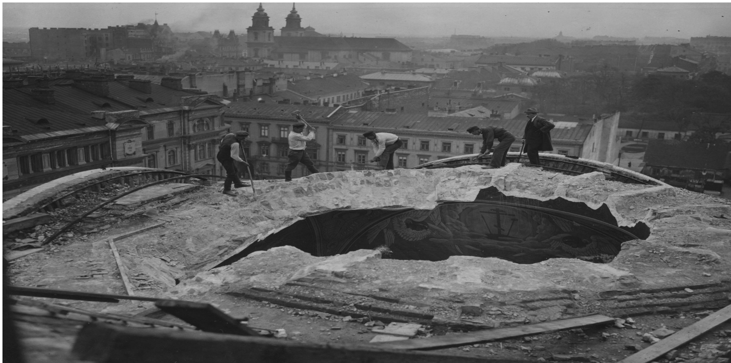
Rozbiórka soboru św. Aleksandra Newskiego, maj 1925 r.

https://przystanekhistoria.pl/pa2/tematy/polityka-historyczna/51838,Derusyfikacja-w-Warszawie-19151926.html