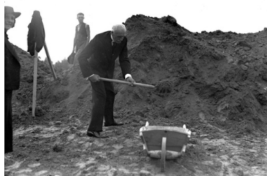
Prezydent Ignacy Mościcki przy sypaniu kopca.

Aby ułatwić masowy dostęp do Sowińca, władze postarały się o uproszczenie podróży do Krakowa i znacznie obniżenie jej kosztów. Liga Popierania Turystyki opracowała plan akcji popularnych przejazdów kolejowych do Krakowa. Aż z 62 miejscowości w Polsce miały wyruszać specjalne pociągi: jeden w tygodniu, a w święta nawet po kilka, niektóre z darmowymi biletami.