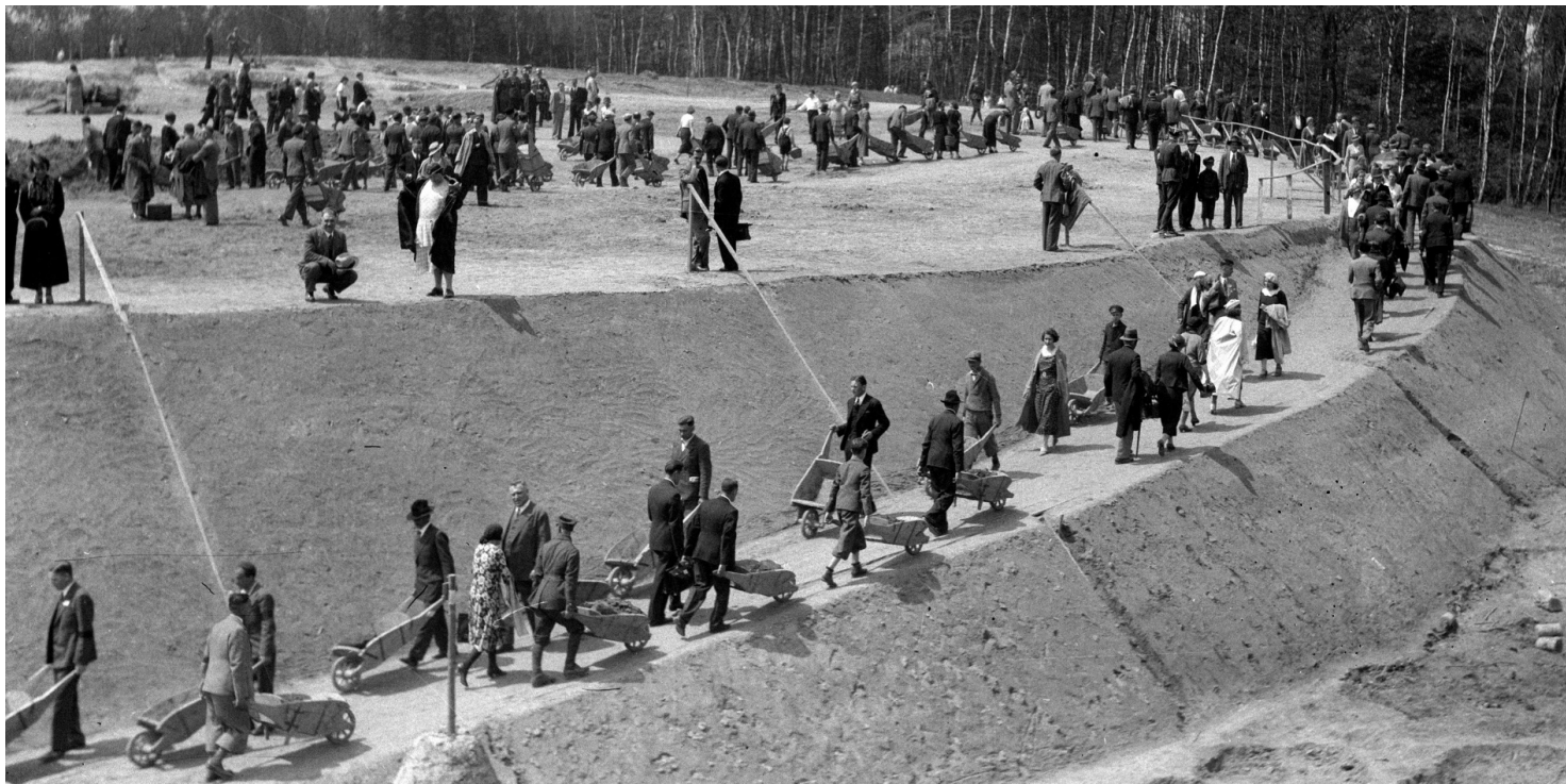
Sypanie kopca Piłsudskiego, maj 1935 r.

https://przystanekhistoria.pl/pa2/tematy/polityka-historyczna/53902,Kopiec-Jozefa-Pilsudskiego-w-Krakowie.html