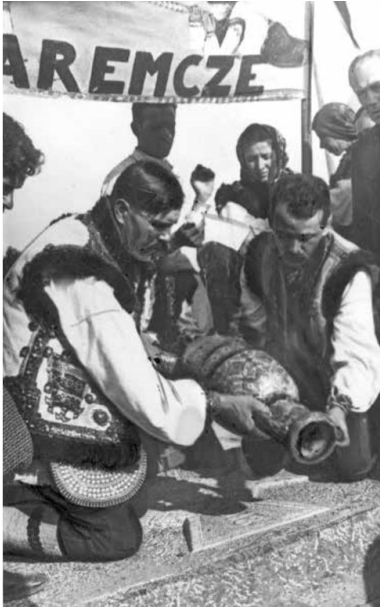
Delegacja Hucułów sypie przywiezioną ziemię.