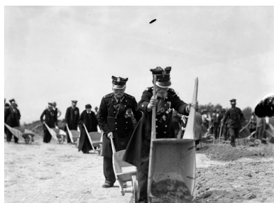
Weterani powstania 1863 roku podczas pracy przy sypaniu kopca na Sowińcu, maj 1935 r.