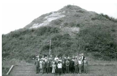
Legioniści pod kopcem w latach siedemdziesiątych.