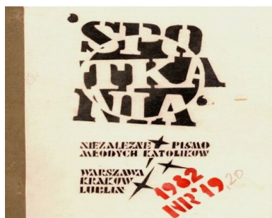
„Spotkania. Niezależne pismo młodych katolików”; nr 19 z roku 1982