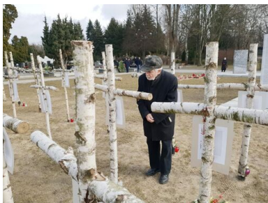
„Łączka”, 1 marca 2019. Fot.