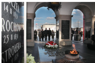
Grób Nieznanego Żołnierza, uroczystości 1 marca na placu marsz. Józefa Piłsudskiego w Warszawie, 2020.

Podziemie przeprowadzało także akcje dyscyplinujące – w tym wykonywało wyroki śmierci wydane przez dowódców oddziałów na szczególnie aktywnych działaczach narzuconego Polsce przez Moskwę reżimu czy osoby, które zagrażały partyzantom – np. donosząc bezpiece.