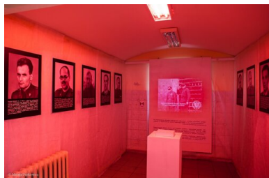
Z wystawy „Dowody zbrodni” - Warszawa, 28 lutego 2018.

Z perspektywy historycznej zatem, jeśli patrzymy na zbrojne podziemie powojenne, widzimy w nim kontynuację działań niepodległościowych. Jednak niektóre akcje czy decyzje dowódców podziemia stają się pretekstem nie tyle do dyskusji nad nimi, co podniesione do rangi zasady ogólnej służą działaniom, które mają skompromitować aktywność podziemia w ogóle.