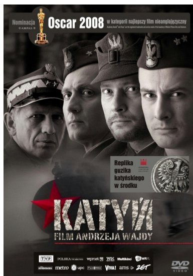
Plakat filmu "Katyń" w reżyserii Andrzeja Wajdy