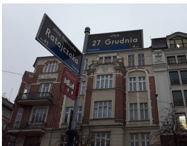
Skrzyżowanie ul. Franciszka Ratajczaka i 27 Grudnia, styczeń 2021 r.