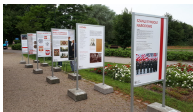
Wystawa IPN „Polskie Symbole Narodowe” - Gdańsk, 4 lipca 2020 r.

Istotne znaczenie miały poglądy polityczne badanych: 64% osób deklarujących się jako zwolennicy PiS (i innych partii Zjednoczonej Prawicy) popierało dekomunizację ulic. Przeciwni jej byli zwolennicy PO – 58% i Nowoczesnej – 55%.