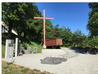
Skwer Kresowy w Zielonej Górze-

Z czasem teren wokół pomnika został uporządkowany i doszły kolejne płyty. Pojawił się również wagon kolejowy, przypominający o tułaczce mieszkańców Kresów. W 2018 r., na kolejnej płycie, pojawiła się tablica upamiętniająca Węgrów, którzy pomagali Polakom w walce z oddziałami ukraińskich nacjonalistów. Przed monumentem ułożony jest z kostki brukowej kontur przedwojennej granicy Polski wraz z tabliczkami z nazwami największych miast. Od kilku już lat Skwer Katyński jest jednym z najważniejszych miejsc spotkań żyjących jeszcze kresowian oraz ich potomków w południowej części województwa lubuskiego. Przy organizowanych tam uroczystościach, na zaproszenie organizatorów, udział bierze zawsze przedstawiciel poznańskiego oddziału Instytutu Pamięci Narodowej.