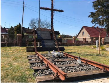
Pomnik Zesłańców Sybiru w Jasieni.

Pomnik Pamięci Narodowej przy al. Niepodległości w Lubsku odnosi się m.in. do tragedii mieszkańców Kresów. Powstanie pomnika związane jest z pojawieniem się w tym miejscu głazu z tablicą poświęconą ofiarom sowieckiego totalitaryzmu. Jej odsłonięcie nastąpiło w 1995 r. z inicjatywy Związku Sybiraków, którego działacze w ten sposób chcieli przypomnieć o 55. rocznicy pierwszej masowej deportacji obywateli polskich w głąb ZSRS z 10 lutego 1940 r. Druga tablica, na kolejnym głazie, ustanowiona została w 2008 roku i dotyczyła żołnierzy Wojska Polskiego walczących na wszystkich frontach w latach 1939-1945.