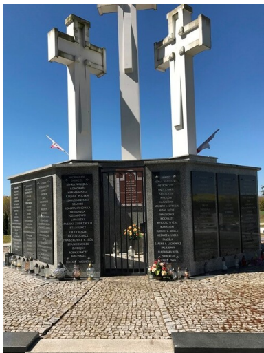
Pomnik Nekropoli Kresowych w Świebodzinie.