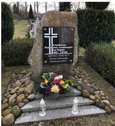
Pomnik upamiętniający polskich obywateli deportowanych z Kresów Wschodnich.

Warto przy tym dodać, że w Krośnie Odrzańskim istnieje również rondo im. Zesłańców Sybiru, które położone jest na skrzyżowaniu drogi krajowej nr 29 i drogi wojewódzkiej nr 276. Oficjalne uroczystości z okazji nadania imienia miały miejsce 17 września 2018 roku, kiedy to na rondzie odsłonięto tablicę z nazwą. W Krośnie Odrzańskim, przy Kole nr 5 Związku Sybiraków, działa również od tego samego roku Klub Wnuków Sybiraków.