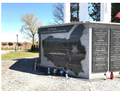
Pomnik Nekropoli Kresowych w Świebodzinie.