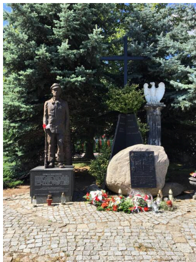
Pomnik Żołnierza Polskiego z Kresów przy kościele parafialnym pw. św. Józefa w Żarach.