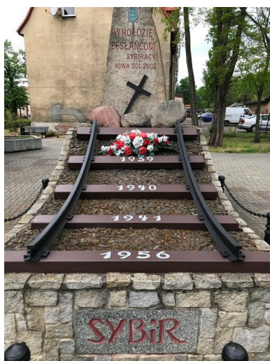
Skwer Sybiraków w Nowej Soli.