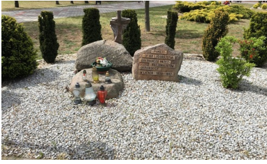
Pomnik ofiar ludobójstwa dokonanego przez nacjonalistów ukraińskich w latach 1939-1947.