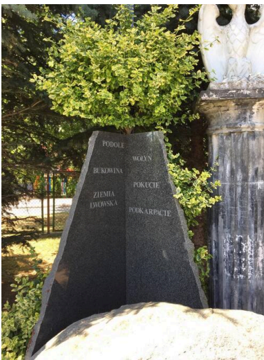
Pomnik Polskich Ofiar Ukraińskiego Ludobójstwa

O tragedii Polaków na terenach południowo-wschodnich II RP przypomina m.in. Pomnik Polskich Ofiar Ukraińskiego Ludobójstwa 1939-1947. Jest on częścią Pomnika Żołnierza Polskiego z Kresów i znajduje się przy kościele parafialnym pw. św. Józefa.