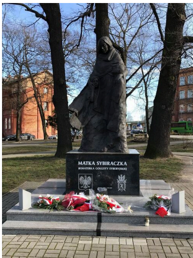
Pomnik Matki Sybiraczki w Zielonej Górze.