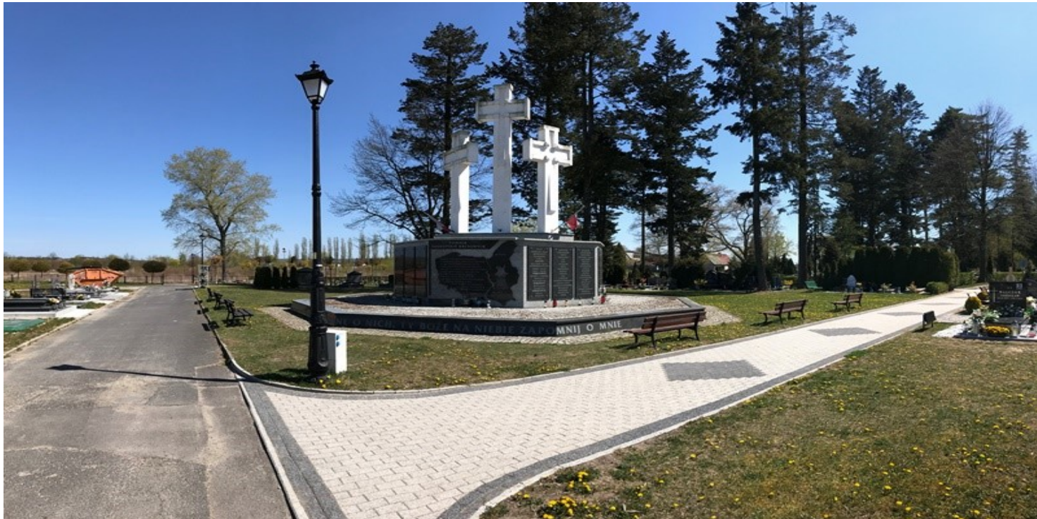
Pomnik Nekropoli Kresowych w Świebodzinie.

https://przystanekhistoria.pl/pa2/tematy/polityka-historyczna/96364,Miejsca-Pamieci-o-Kresach-na-terenie-Ziemi-Lubuskiej.html