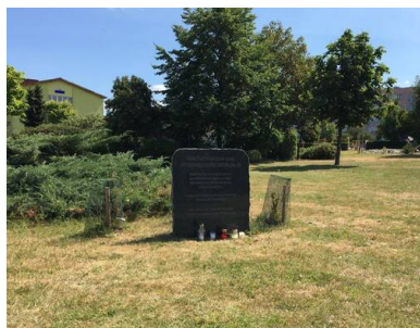
Tablica pamięci pomordowanych

Kolejnym upamiętnieniem jest tablica pamięci pomordowanych oraz dęb posadzony ku czci Zygmunta Jana Rumla – przedstawiciela ruchu ludowego i żołnierza kampanii z 1939 r. oraz uczestnika konspiracji w szeregach Batalionów Chłopskich. Ten świetnie zapowiadający się poeta został zamordowany w lipcu 1943 r. przez ukraińskich nacjonalistów podczas misji, która miała polegać na prowadzeniu rozmów z lokalnymi strukturami Ukraińskiej Powstańczej Armii (UPA). Tablica wraz z dębem od 2013 r. znajduje się w Alei Pamięci Narodowej przy ul. Szymanowskiego.