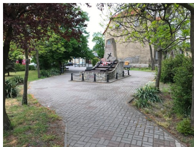
Skwer Sybiraków w Nowej Soli.

Sam pomnik ma formę głazu, na szczycie którego jest symbol Związku Sybiraków i napis „W hołdzie Zesłańcom. Sybiracy. Nowa Sól 2002”. Na cokole z kamiennych kostek ułożony został fragment torów kolejowych z wypisanymi na belkach latami deportacji. Od wielu lat właśnie w tym miejscu odbywają się uroczystości – zarówno upamiętniające deportacje, jak i rocznicę agresji sowieckiej na Polskę z 17 września 1939 r.