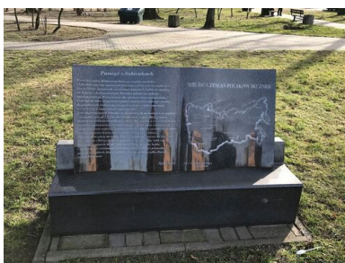
Tablica informacyjna przy pomniku Matki Sybiraczki w Zielonej Górze.