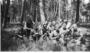
Żołnierze Wojska Polskiego z obozu organizacyjnego i szkoleniowego w Coëtquidan dla odbudowującej się we Francji armii polskiej, 1939 - 1940.