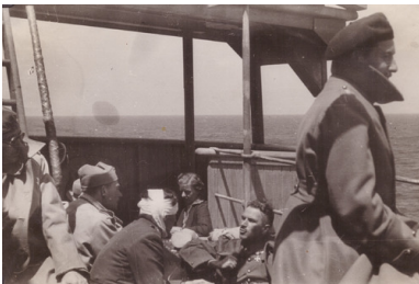
Polscy żołnierze na okręcie podczas ewakuacji do Anglii, czerwiec 1940.

Do transportu polskich wojskowych wykorzystywano statki różnych bander: nie tylko państw sojuszniczych, lecz także krajów neutralnych, zwłaszcza Rumunii i Grecji. Zaangażowano również statki polskie, w tym s/s „Warszawa”, który regularnie kursował na trasie Pireus – Marsylia, a także dorywczo na trasie Split – Marsylia.