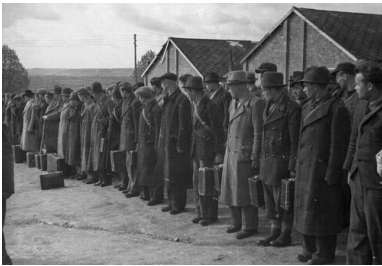
Przybycie transportu mężczyzn do Wojska Polskiego we Francji, 1939 - 1940. Poborowi na zbiórce.

Największe jednak nadzieje na odtworzenie polskiej armii wiązano z poborem Polaków przebywających we Francji oraz z wojskowymi internowanymi na Węgrzech, w Rumunii i w krajach bałtyckich.