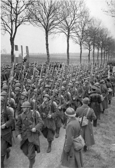
1940, defilada piechoty z 1. Dywizji Grenadierów Wojska Polskiego we Francji podczas obchodów święta 3 Maja i uroczystości nadania miana Grenadierów (odbywających się przy szosie Autreville-Martigny).

Jeśli chodzi o kraje bałtyckie, najwięcej polskich żołnierzy znalazło się na Litwie. Państwo to otworzyło swoje granice dla uchodźców wojskowych i cywilnych 19 września, a masowy napływ uchodźców trwał do 26 września. Później granicę przekraczały tylko niewielkie grupy wojskowych i cywilów. Według danych Litewskiego Czerwonego Krzyża z połowy października 1939 r., na Litwie znalazło się 14 tys. polskich wojskowych, co pokrywa się z obliczeniami polskich autorów 27 . Żołnierzy umieszczono w obozach internowania zlokalizowanych na ogół w uzdrowiskach lub miejscowościach wypoczynkowych 28 .