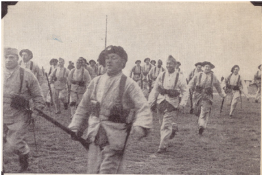
Polscy żołnierze w czasie ćwiczeń we Francji, 1939 - 1940.