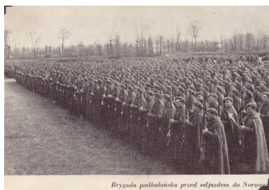
Brygada podhalańska przed odjazdem do Norwegii

Polscy żołnierze na okręcie podczas ewakuacji do Anglii, czerwiec 1940. Kopia cyfrowa pozyskana do IPN ze Stowarzyszenia Weteranów Armii Polskiej w Ameryce (właściciela praw autorskich)