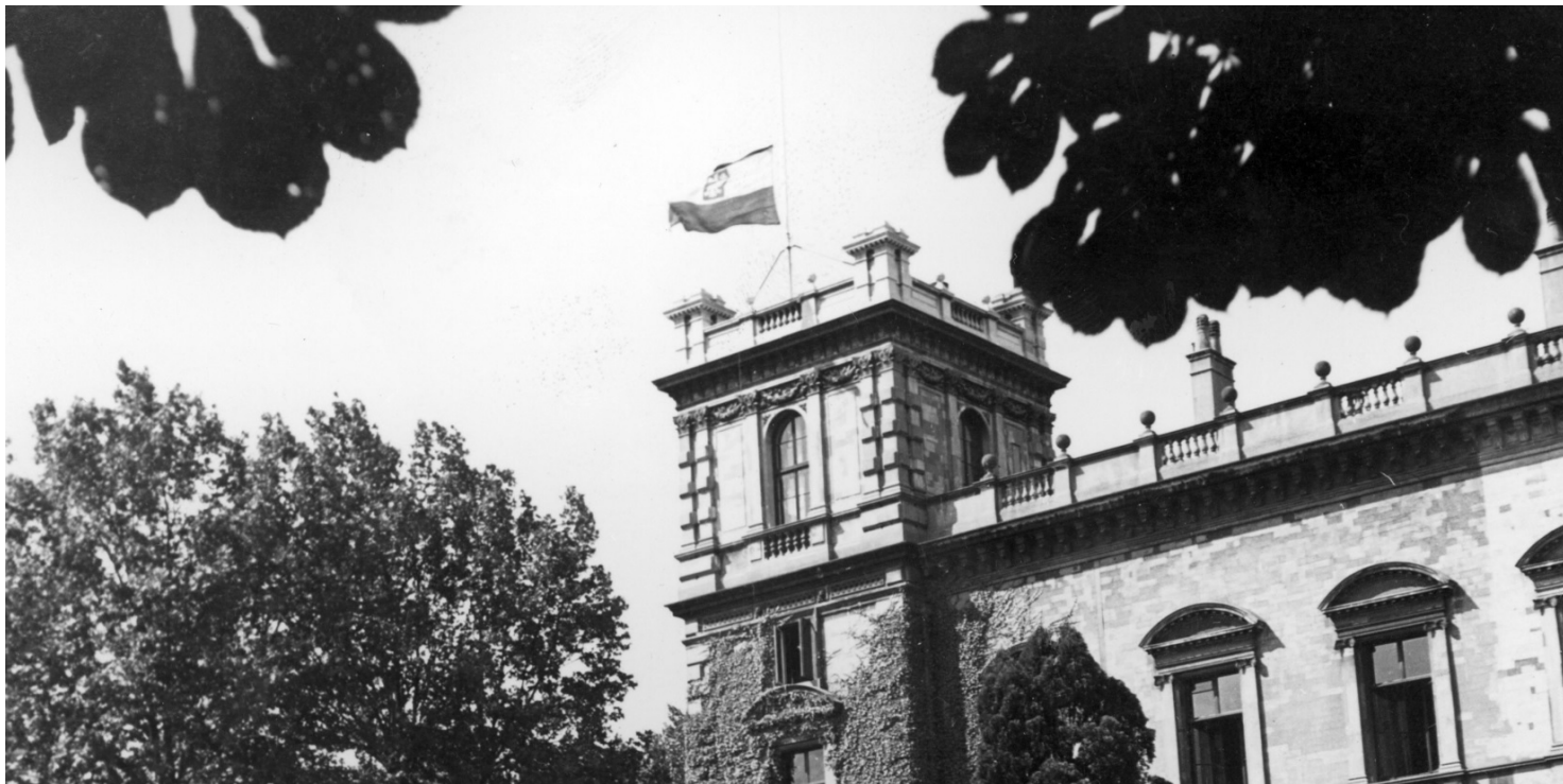
Polska flaga na gmachu siedziby Rządu RP na Uchodźstwie (Pałac Rothschildów), 1943 r. Fot. NAC

https://przystanekhistoria.pl/pa2/tematy/polska-na-uchodzstwie/89371,Wobec-sowieckiego-zaboru-Polska-w-Londynie.html