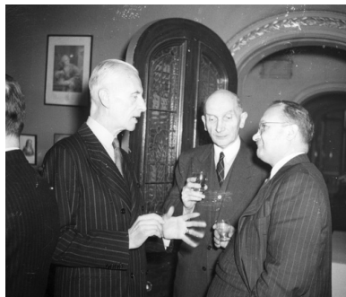
Prezydent RP Władysław Raczkiewicz i szef jego Kancelarii Cywilnej August Zaleski (przyszły następca Głowy Państwa) podczas rozmowy z Karolem Rozmarkiem, prezesem Kongresu Polonii Amerykańskiej - Londyn, 1945.

Celem „Zamku” stało się budowanie silnej koalicji politycznej, która umożliwiłaby stabilizację sytuacji prezydenta i mianowanego przez niego premiera. Z kolei opozycja antyprezydencka dążyła do stworzenia reprezentacji politycznej na tyle mocnej, by możliwe stało się zmuszenie Zaleskiego do ustąpienia ze sprawowanej funkcji.