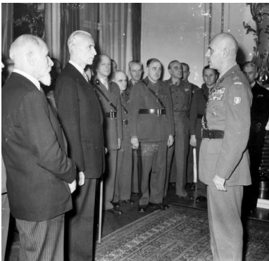
Spotkanie noworoczne u Prezydenta RP. Na pierwszym planie od lewej stoją: premier Tomasz Arciszewski, prezydent Władysław Raczkiewicz, gen. Władysław Anders - styczeń 1945 r.

W chwili gdy mocarstwa zachodnie wycofały swe uznanie dla rządu RP na uchodźstwie, jego premierem pozostawał socjalista Tomasz Arciszewski, natomiast urząd prezydenta nieprzerwanie od września 1939 r. pełnił Władysław Raczkiewicz. Polskie władze nie uznały dyktatu wielkich mocarstw, decydując się na utrzymanie struktur rządowych, których celem nadal pozostawała walka o odzyskanie przez Polskę niepodległości. Prezydent i premier oświadczyli, że wciąż stanowią jedyne legalne władze polskie. W 1946 r. utworzono dodatkowo Radę Polskich Stronnictw Politycznych, w której zgromadzono przedstawicieli większości sił politycznych działających na uchodźstwie.