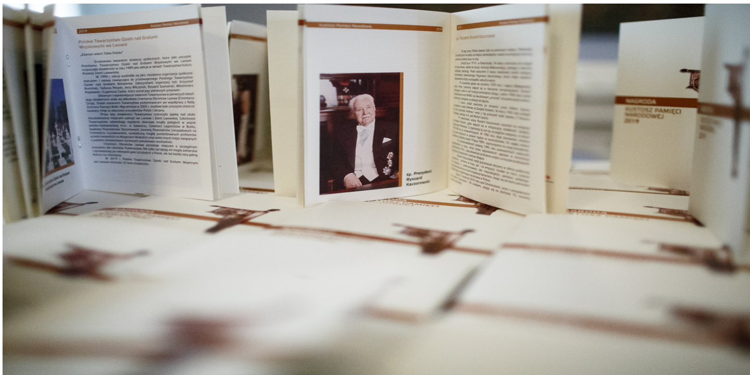
Gala Nagrody „Kustosz Pamięci Narodowej” – 28 maja 2019 r.

https://przystanekhistoria.pl/pa2/tematy/polska-na-uchodźstwie/95635,Zylismy-nadzieja.html