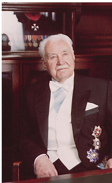
Prezydent Ryszard Kaczorowski

RK: Symbolika odegrała w dziejach naszego narodu ogromną rolę. Nie po raz pierwszy ta symbolika była wykorzystana w walce o niepodległość. Marszałek Piłsudski w swojej pracy o powstaniu styczniowym podkreślał, i sam potem używał tego argumentu, że niezależnie od tego, kto państwem włada, źródłem siły jest rząd narodowy, który włada duszami. Z takiej pozycji wychodziliśmy, uważając, że zachowanie legalizmu, cele wojenne, do których Polska została zmuszona przystąpić, nie zostały osiągnięte. Nasza postawa trwania to była bezoreźna walka o przyszłość Polski.