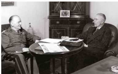
Gen. Władysław Sikorski i prezydent Władysław Raczkiewicz.