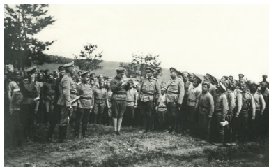
Aleksander Kiereński przed frontem XXXVIII Korpusu Armijnego w obecności gen. Józefa Dowbora-Muśnickiego i gen. Antona Denikina, 1917 r.

Mimo niezliczonych przeszkód kolejne oddziały polskie docierały stopniowo na miejsce koncentracji, ponosząc jednak duże straty. Odbywało się to bowiem w trudnych zimowych warunkach i wśród ciągłych walk z bolszewikami. W tym czasie liczebność korpusu spadła do ok. 12 tys. ludzi. Jednak nieprzyjacielowi nie udało się rozbić polskich jednostek, których morale okazało się nie do złamania. Stopniowo formował się front polsko-bolszewicki. 1. Dywizja Strzelców Polskich zajęła pozycje pod Rohaczowem, 2. Dywizja między Rohaczowem a Bobrujskiem, a 3. Dywizja znajdowała się w marszu z Jelni pod Smoleńskiem i dotarła do głównych sił kilka tygodni później, 3 marca 1918 r. W Dukorze pod Mińskiem stacjonował 1. Pułk Ułanów, który zabezpieczał teren koncentracji od zachodu.