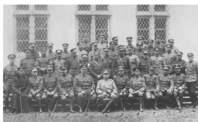
Dowódcy oddziałów I Korpusu Polskiego z generałem Józefem Dowborem-Muśnickim (siedzi 6. z lewej), Bobrujsk 1917 r.

A Maria Dąbrowska w swoich Dziennikach, choć nieco bardziej sceptyczna wobec informacji o sukcesach polskich wojsk na Wschodzie, również dawała upust swemu zachwytowi dla gen. Dowbora: „To, co robi Dowbór-Muśnicki, to jakby baśń historii”.