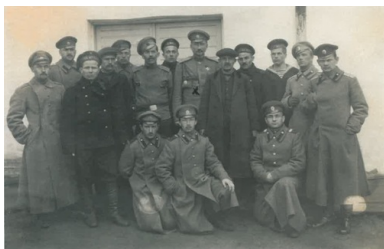
Generał Dowbor-Musnicki w otoczeniu delegatów Rad Robotniczych i Żołnierskich w sztabie I Armii Rosyjskiej w 1917 r.