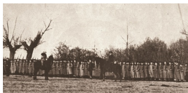
Ćwiczenia wojskowe 2. kompanii Legionu, styczeń 1915 r.

Rosyjskie dowództwo, cały czas odnoszące się do Polaków podejrzliwe, nie nadało jednak legionom statusu regularnego wojska, lecz formacji pomocniczych: formalnie ich celem miały być działania rozpoznawczo-partyzanckie i dywersyjne na tyłach nieprzyjaciela. Na miejsce stacjonowania formującego się legionu wyznaczono zabudowania Instytutu Agronomicznego i Leśnego w Puławach. Pierwszych 70 ochotników dotarło do Puław z Brześcia i Chełma 4 grudnia 1914 r., pozostali zaś przybyli w liczbie kilkuset z Warszawy, a nawet tak odległych miast jak Wilno czy Kijów – pod koniec tego miesiąca. Byli wśród nich partyzanci Snarskiego i ułani hr. Tyszkiewicza.