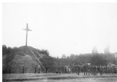
Poświęcenie kopca ku czci poległych żołnierzy I Korpusu Polskiego, 1918 r.

Nadszedł maj 1918 r. – w Bobrujsku odbywały się uroczyste obchody święta 3 Maja, będące pokazem siły i triumfu I Korpusu Polskiego. Podobne obchody zorganizowano także w innych miejscowościach, np. w Nowym Bychowie i Mohylewie. Małe państwko trwało już trzy miesiące. Ulicami miast kresowych defilowały tysiące żołnierzy i ułanów, paradowała artyleria i wozy pancerne, a na niebie przeleciały nawet polskie samoloty.