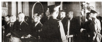
Ława oskarżonych w procesie Szesnastu, Moskwa, czerwiec 1945 r.

Jak z tego wynika, wiosną 1945 r. Churchill walczył ze Stalinem o niezawisłą Polskę – acz w nowym kształcie terytorialnym i bez legalnego rządu polskiego 18 . Sojusznikiem Anglika w tej walce miał być Mikołajczyk. Churchill zrobił wszystko, by przełamać sowiecki opór przeciwko jego zaproszeniu do Moskwy, co miało umożliwić polskiemu politykowi niedopuszczenie do powstania Tymczasowego Rządu Jedności Narodowej zdominowanego przez komunistów.