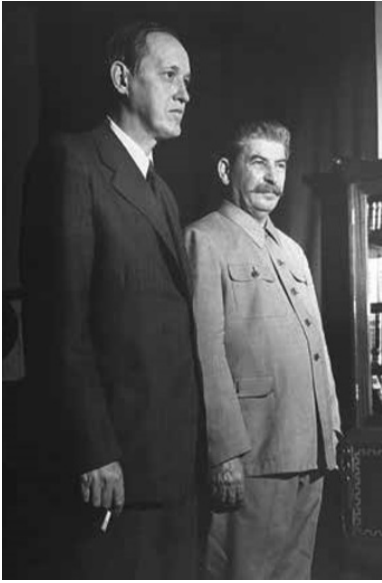
Harry Hopkins i Józef Stalin, 1941