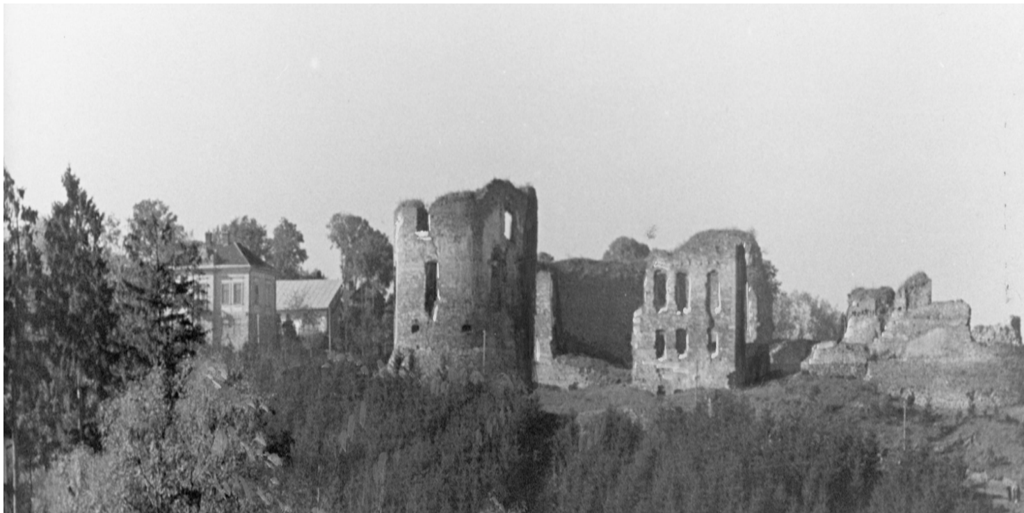
Ruiny Zamku w Buczaczu

https://przystanekhistoria.pl/pa2/tematy/polskie-panstwo-podziem/62811,Okreg-AK-Tarnopol.html