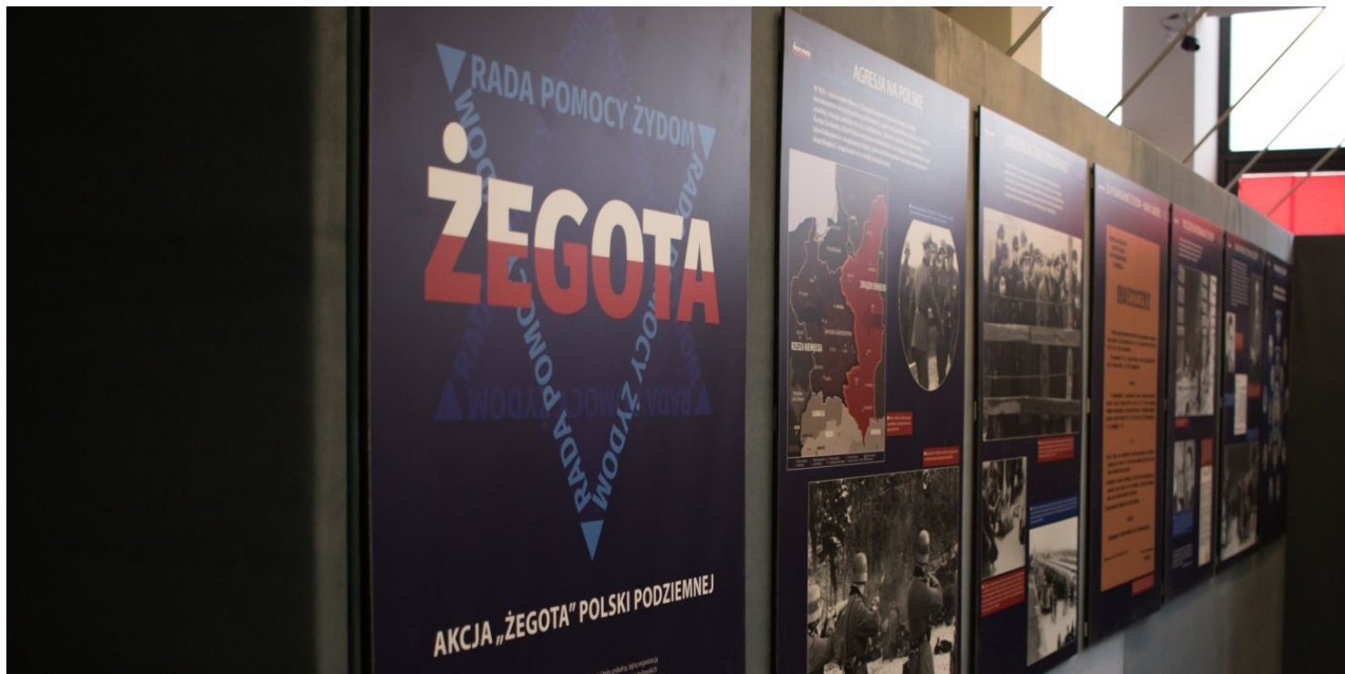
Wystawa „Akcja »Żegota« Polski Podziemnej”.

https://przystanekhistoria.pl/pa2/tematy/polskie-panstwo-podziem/64383,Wspolpraca-Rady-Pomocy-Zydom-i-Międzyorganizacyjnego-Biura-Dokumentarnego.html