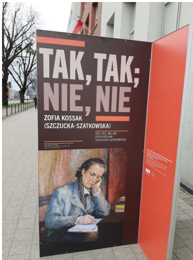
Plansza z wystawy Muzeum II Wojny Światowej w Gdańsku: „Tak, tak; nie, nie. Zofia Kossak (Szczucka-Szatkowska)”, wyeksponowanej w 2020 r. przez Oddział IPN w Gdańsk.