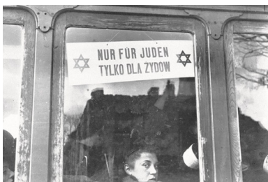
Tramwaj w getcie warszawskim, październik 1940 r.

Wydawało się pisarce, że milczącą obojętność zachowują wobec niesłychanej zbrodni także Polacy, zarówno przedwojenni „polityczni przyjaciele Żydów”, jak i ich przeciwnicy.