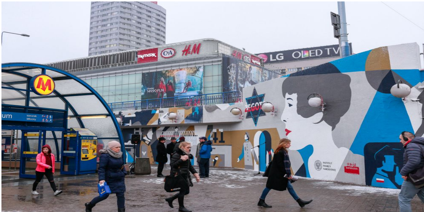
Mural poświęcony Radzie Pomocy Żydom „Żegota”.

https://przystanekhistoria.pl/pa2/tematy/polskie-panstwo-podziem/71223,Bozy-szaleniec-w-czasach-Zaglady-Zofia-Kossak-Szczucka.html