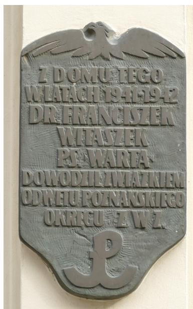
Tablica upamiętniająca Franciszka Witaszka na kamienicy przy ul. Wrocławskiej 5 w Poznaniu.

Według relacji Haliny Witaszek (żony) jego zespół prowadził z Niemcami wojnę bakteriologiczną. Przedostawano się do niemieckich szpitali wojskowych w Poznaniu, gdzie, na poręczach schodów, celowo pozostawiano szkodliwe bakterie, co miało swoje konsekwencje zdrowotne dla przebywających w nim żołnierzy niemieckich, zwłaszcza ich dłuższą niezdolność do służby wojskowej. Potwierdzała również, że podobnie czyniono w hotelach. Tam dodatkowo szkodliwe bakterie oraz środki chemiczne dodawano do napojów. Wśród szkodliwych środków były m.in. bakterie tyfusu czy bakterie powodujące rozkład nerek.