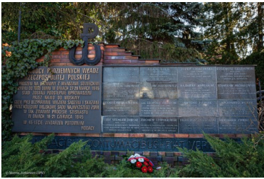
Pruszków, pomnik pamięci 16 przywódców Polskiego Państwa Podziemnego - ofiar sowieckiej zbrodni w 1945 r.

następujące wyroki: gen. Okulicki – 10 lat więzienia, Jankowski – 8 lat, Bień – 5 lat, Jasiukowicz – 5 lat, Pużak – 1,5 roku, Bagiński – 1 rok, Zwierzyński – 8 miesięcy, Czarnowski – 6 miesięcy, Mierzwa, Stypułkowski, Chaciński, Urbański – 4 miesiące. Uniewinnieni zostali: Michałowski, Kobylański i Stemler-Dąbski, zaś Pajdak w osobnym procesie został skazany na 5 lat więzienia 6 .