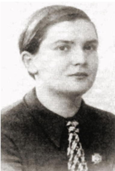
Anna Smoleńska.

W okupowanej Polsce walka podziemna miała szczególnie duży zasięg. Wielką rolę odgrywał w niej tzw. mały sabotaż, czyli walka propagandowa, między innymi przy pomocy napisów i konspiracyjnych symboli. Swego rodzaju uwieńczeniem akcji małego sabotażu tego typu było rozpowszechnianie „kotwicy” jako znaku Polski Walczącej.