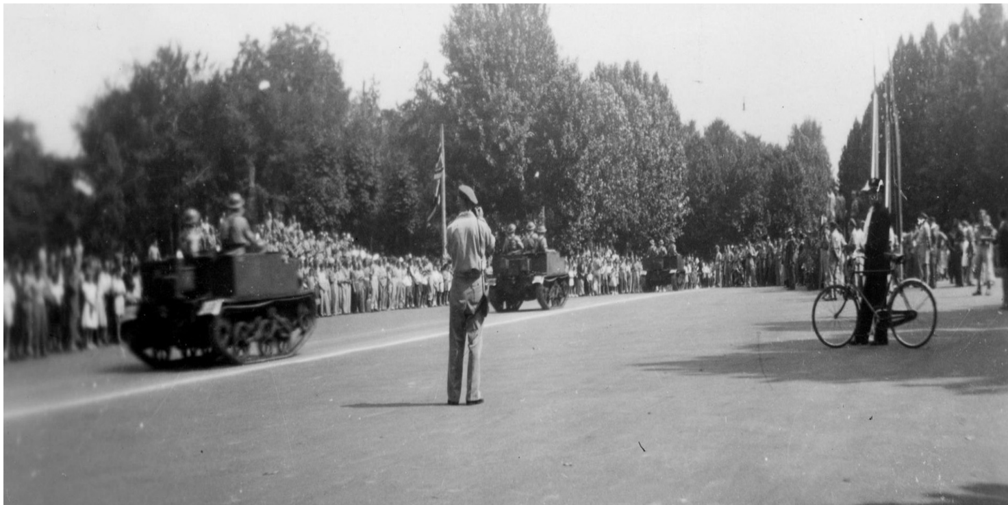
Lekkie transportery gąsienicowe Universal Carrier z żołnierzami 4. Wołyńskiej Brygady Piechoty, wchodzącej w skład 5. Kresowej Dywizji Piechoty, przejeżdża ulicą (Foro Buonaparte?) przed zamkiem Sforzów (wł. Castello Sforzesco) podczas defilady przed dowódcą 2. Korpusu Polskiego gen. dyw. Władysławem Andersem z okazji Święta Żołnierza. Mediolan, 15 VIII 1946 r.

https://przystanekhistoria.pl/pa2/tematy/polskie-sily-zbrojne-po/102759,Z-ziemi-wloskiej-Defilada-2-Korpusu-Polskiego-w-Mediolanie.html