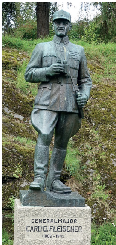
Pomnik dowódcy 6. Dywizji Piechoty gen. Carla Gustava Fleischera w Harstad.

Na początku maja Brytyjczycy usiłowali przegrodzić Niemcom drogą w Bodø, Mo i Rana oraz Mosjøen. Mimo kilku porażek związali tam Niemców do końca maja, ograniczając znacznie ich możliwości działań przeciwko sojuszniczemu zgrupowaniu. Straty w okrętach były jednak duże. To pod Bodø 14 maja został zbombardowany przez Luftwaffe i zatonął polski transatlantyk „Chrobry” (zaadaptowany na transportowiec wojskowy). Na jego pokładzie znajdował się batalion Gwardii Irlandzkiej.