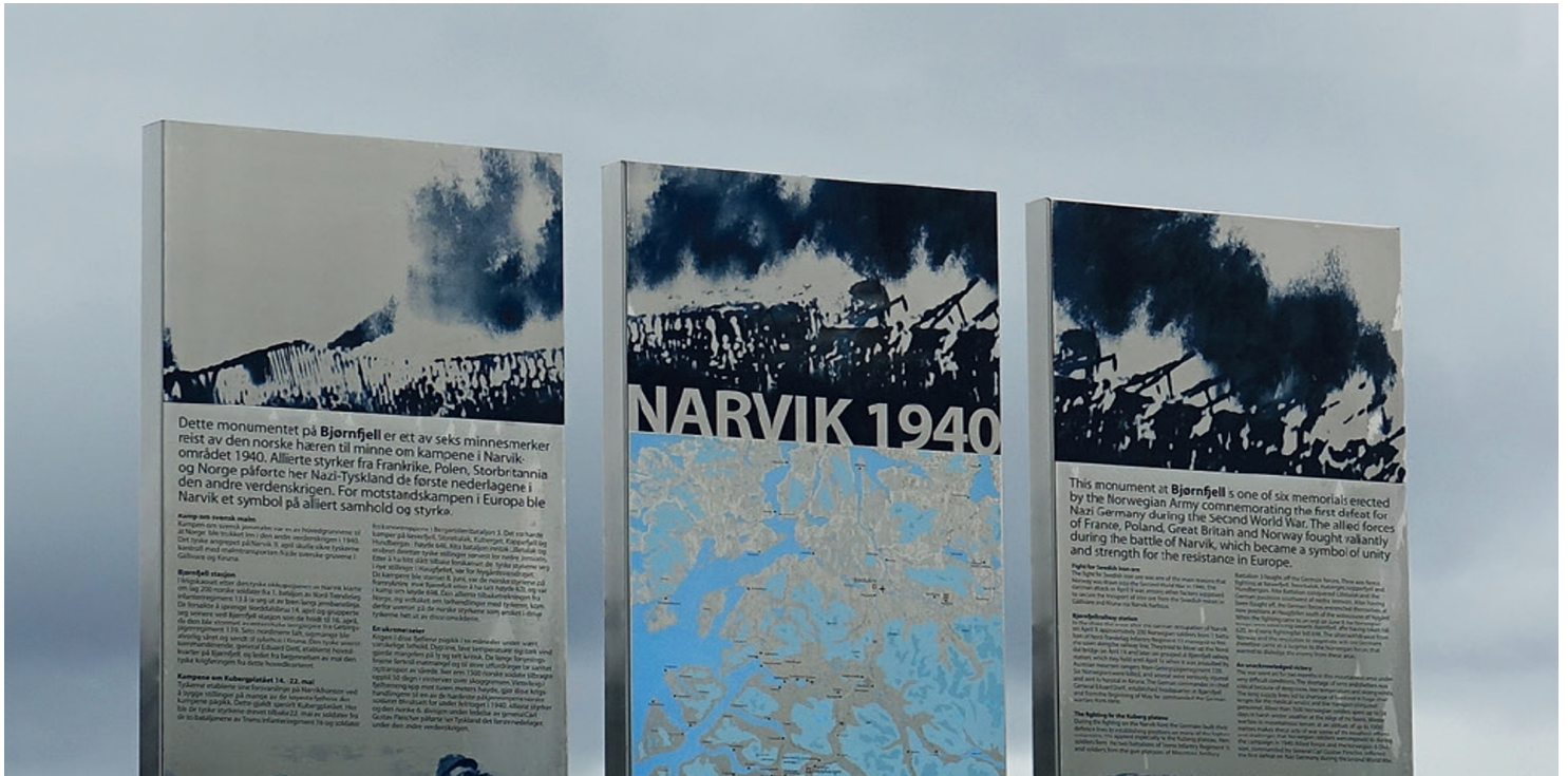
Instalacja upamiętniająca bitwę o Narwik.

https://przystanekhistoria.pl/pa2/tematy/polskie-sily-zbrojne-po/104454,Polacy-w-bitwie-o-Narwik.html