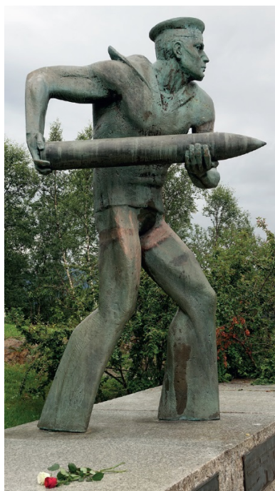
Pomnik polskich marynarzy w Narwiku upamiętniający poległych na ORP „Grom”.

Plan zakładał, że wspólnie z francuską 13. Półbrygadą Legii Cudzoziemskiej, alpejczykami oraz oddziałami norweskimi będzie uczestniczył w koncentrycznym ataku na Gratangen-Bjerkvik. 13 maja legioniści opanowali desantem z morza Bjerkvik, a 2. batalion podhalańczyków zajął półwysep Øyjord, który przekazał Francuzom. Wysiłek ten doprowadził do uchwycenia baz wyjściowych, z których wyprowadzono od północy uderzenie na Narwik. Następnie baon przerzucono kutrami na południową część półwyspu Ankenes. Tam dołączył do niego 1. batalion. Doszło wówczas do pauzy operacyjnej. Wyodrębniły się dwa główne odcinki działań: w rejonie Ankenes, gdzie operowali Polacy, oraz na północ od fiordu Rombaken, który obsadzili Francuzi i Norwegowie.