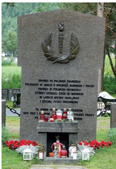
Polska kwatera wojskowa na cmentarzu w Ankenes.

Na południu i zachodzie Norwegii z konfrontacji zwycięsko wychodzili jednak Niemcy. Zgrupowanie bojowe norweskiej 4. Dywizji Piechoty, operującej samodzielnie w rejonie Bergen-Stavanger, utrzymało się do końca kwietnia. Chaotyczne, kiepsko zaplanowane i jeszcze gorzej przeprowadzone lądowania alianckie w Namsos i Åndalsnes (12–19 kwietnia) zakończyły się fatalnie. Zamiast odbić Trondheim i utworzyć stabilną bazę do dalszych działań, wysadzone oddziały zostały powstrzymane i już 2 maja zdecydowano się je ewakuować. Sukces niemiecki wynikał w dużej mierze z przewagi w powietrzu, co skutecznie paraliżowało brytyjską marynarkę.