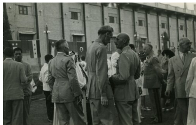
Józef Czapski z Władysławem Andersem