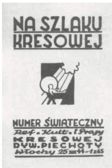
„Na szlaku kresowej”, nr 25 1944, okładka

21 lipca 1943 r. Naczelnny Wódz gen. Kazimierz Sosnkowski powołał 2. Korpus pod dowództwem gen. Władysława Andersa. Formacja skupiła żołnierzy o różnych rodowodach i wojennych drogach. W zależności od miejsc, z których przybyli, nazywano ich: „prawosławnymi”, jeżeli rekrutowali się z Armii Polskiej w ZSRS gen. Andersa, wcześniej doświadczyli łagrów, zsyłek i więzień na „niehumanitarnej ziemi”, „ramzesami”, jeśli wywodzili się z Samodzielnej Brygady Strzelców Karpackich gen. Stanisława Kopańskiego, mając za sobą walki pod El-Ghazalą i Tobrukiem, „lordami”, gdy byli oficerami i podchorążymi przybyłymi z Wielkiej Brytanii. We Włoszech dołączyli do nich „kacetowcy” i „oflagowcy” – uwolnieni więźniowie z obozów koncentracyjnych i jenieckich. Ich przeżycia wywarły silny wpływ na charakter 2. Korpusu i jego działalność społeczną, polityczną i nade wszystko kulturalną.