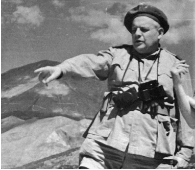
Melchior Wańkowicz pod Monte Cassino

Zgodnie z zaleceniami Dowódcy Korpusu nie łudzono żołnierza „tanim optymizmem”, wpajając, że „własnym wysiłkiem i walką zbrojną może przyspieszyć pełne wyzwolenie Polski”. Stosownie do słów gen. Andersa: „Nie bijecie się o Monte Cassino, ale o wolność Polski”.