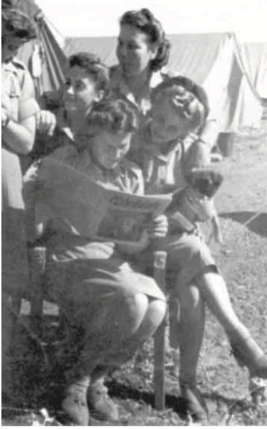
Wspólne czytanie. Ochotniczki w 2 Korpusie