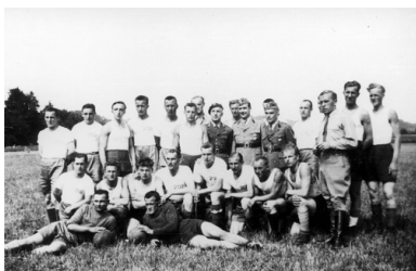
Drużyna piłkarska złożona z żołnierzy 2 Dywizji Strzelców Pieszych, internowanej w Szwajcarii.