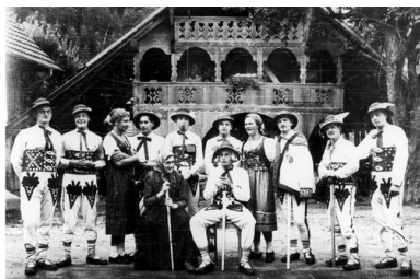
Inscenizacja teatralna przedstawienia "Wesele góralskie" w wykonaniu teatru żołnierskiego 4 Pułku Strzelców Pieszych, internowanego w Szwajcarii.