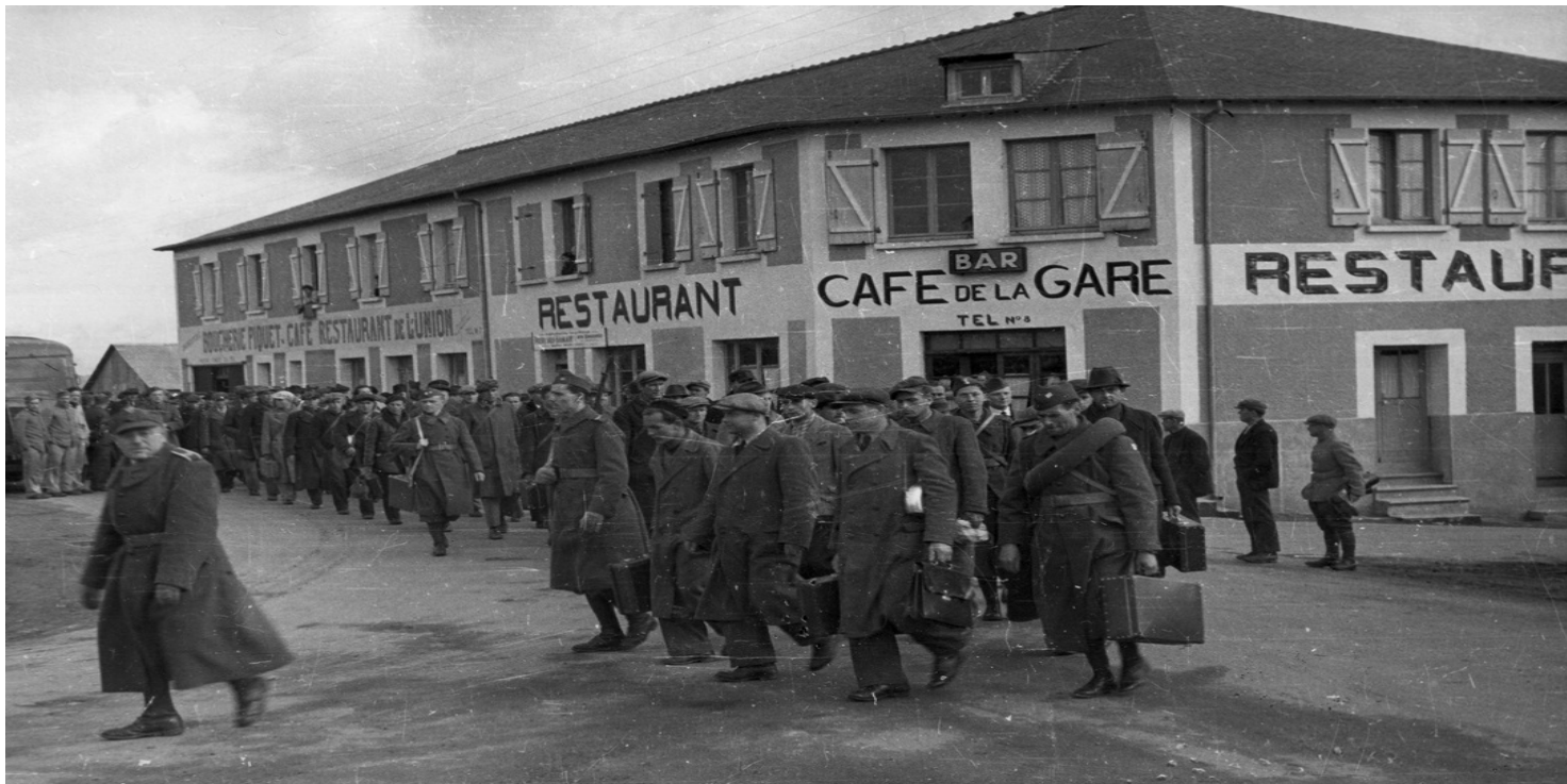
Przemarsz poborowych do Wojska Polskiego ulicami miasta we Francji, 1939-1940 r.

https://przystanekhistoria.pl/pa2/tematy/polskie-sily-zbrojne-po/92261,Wladze-i-Wojsko-Polskie-we-Francji-i-w-Wielkiej-Brytanii-w-latach-1939-1941.html