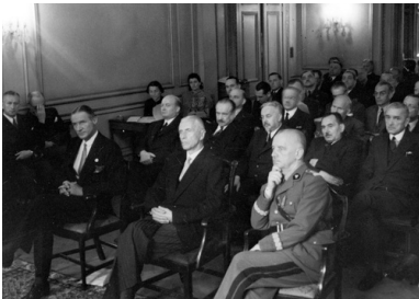
Spotkanie władz RP na uchodźstwie z ambasadorem USA przy rządzie RP Anthony Biddle-Drexelem. Widoczni m.in. - w pierwszym rzędzie od lewej: ambasador Anthony Drexel-Biddle, prezydent RP Władysław Raczkiewicz, premier RP i Naczelnny Wódz, gen. Władysław Sikorski. W drugim rzędzie od