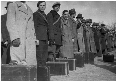
Zbiórka poborowych do Wojska Polskiego we Francji, 1939-1940 r.

W obronie Norwegów walczyła polska marynarka wojenna, tracąc w czasie walk kontrtorpedowiec „Grom”. W końcu maja 1940 r. na Morzu Północnym zaginął okręt podwodny „Orzeł” – chluba polskiej floty, który po działaniach na Bałtyku we wrześniu 1939 r., internowany w estońskim porcie, wypłynął stamtąd bez pozwolenia i mimo braku map w październiku dotarł do Wielkiej Brytanii.