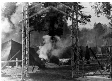
Widok na obóz w Tockoje, 1941-1942 r.

Obóz w Tockoje nie nadawał się na miejsce formowania wielkich jednostek PSZ w ZSRS: zbyt mała liczba miejsc kwaterunkowych, dokuczliwe zimno, braki w podstawowych przedmiotach do codziennego funkcjonowania, przede wszystkim lekarstw. Władze sowieckie mimo wielu zapewnień nie wywiązywały się z odpowiedniej ilości dostaw.