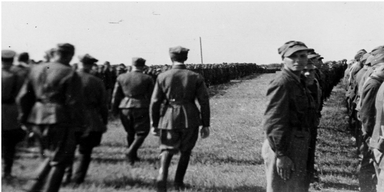
6 Dywizja Piechoty Armii Polskiej w ZSRS. Żołnierze podczas nieustalanej uroczystości w obozie w Tockoje, 1941-1942 r.

https://przystanekhistoria.pl/pa2/tematy/polskie-sily-zbrojne-po/94219,Dywizja-Lwow-6-Dywizja-Piechoty-Polskich-Sil-Zbrojnych-w-ZSRS-19411942.html