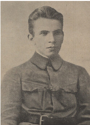
Stanisław Sosabowski na początku XX w.

Stanisław Franciszek Sosabowski urodził się 8 maja 1892 r. w Stanisławowie, na terenie ówczesnej monarchii austro-węgierskiej, w rodzinie kolejarskiej. Kiedy miał 11 lat zmarł jego ojciec.