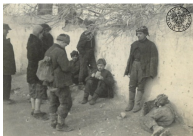
Polscy ochotnicy w drodze do punktów zbórnych armii Andersa

Na mocy układu nastąpiło m.in. wznowienie relacji dyplomatycznych między RP i ZSRS (zerwanych jednostronnie przez ZSRS 17 września 1939 r. wskutek wykonania zobowiązań paktu Ribbentrop-Mołotow), a strona sowiecka zezwoliła na utworzenie Armii Polskiej