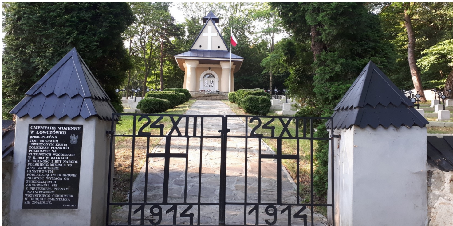
Brama prowadząca na cmentarz legionowy w Łowczówku.

https://przystanekhistoria.pl/pa2/tematy/polskie-wigilie/97674,Legionowa-Wigilia.html