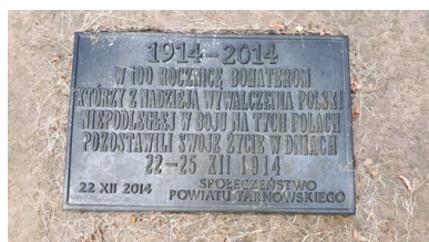
Tabliczka pamiątkowa upamiętniająca 100-lecie bitwy