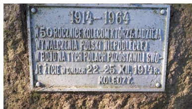
Tabliczka pamiątkowa upamiętniająca 50-lecie bitwy pod Łowczówkiem.

Natarcie prowadzone siłami polskich batalionów, a także przez żołnierzy piechoty węgierskiej oraz ogniem artylerii austriackiej, zakończyło się sukcesem. Oddziały legionowe wykonały swoje zadania, pas wzgórz został odbity. Rosjanie, nie dając za wygraną, przygotowywali przeciwnatarcie. Ogień artylerii i karabinów maszynowych odciął legionistom zaopatrzenie oraz komunikację z dowództwem. W nocy z 23 na 24 grudnia wojska carskie podeszły na bliską odległość, w niektórych miejscach poniżej 50 kroków. Przez cały dzień wigilijny trwał morderczy pojedynek ogniowy oraz odpieranie kontrataków rosyjskich. Przed zmierzchem 24 grudnia Kazimierz Sosnkowski otrzymał rozkaz wycofania brygady. Rozkaz okazał się on jednak nieporozumieniem, co jednak wyjaśniło się po wycofaniu się Polaków. Opuszczone pozycje trzeba było na nowo zdobywać.