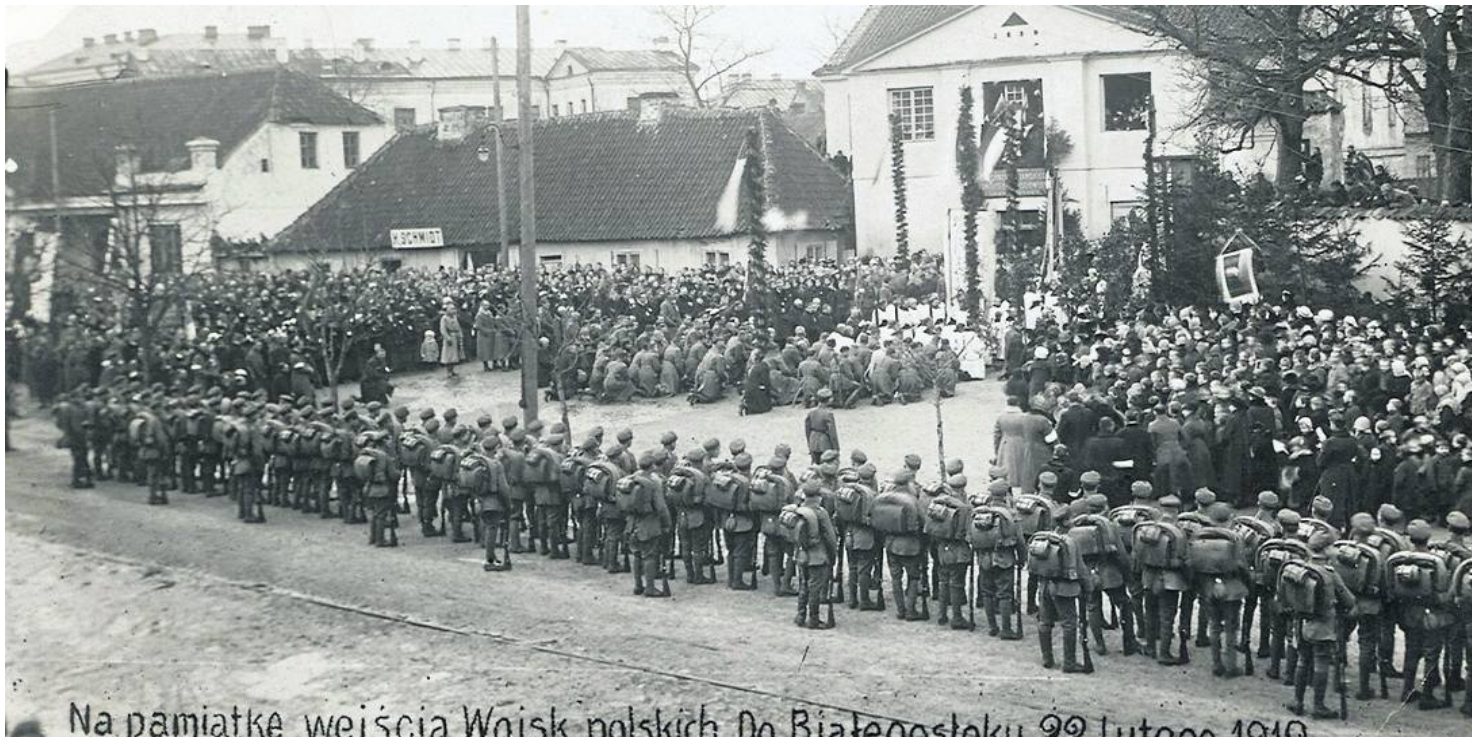
Zdjęcie upamiętniające wejście wojsk polskich do Białegostoku, 22 lutego 1919 r.

https://przystanekhistoria.pl/pa2/tematy/polskie-wojsko/101106,Od-wyzwolenia-Bialeogostoku-w-1919-r-do-obrony-Warszawy-w-1939-r-O-generale-Stani.html