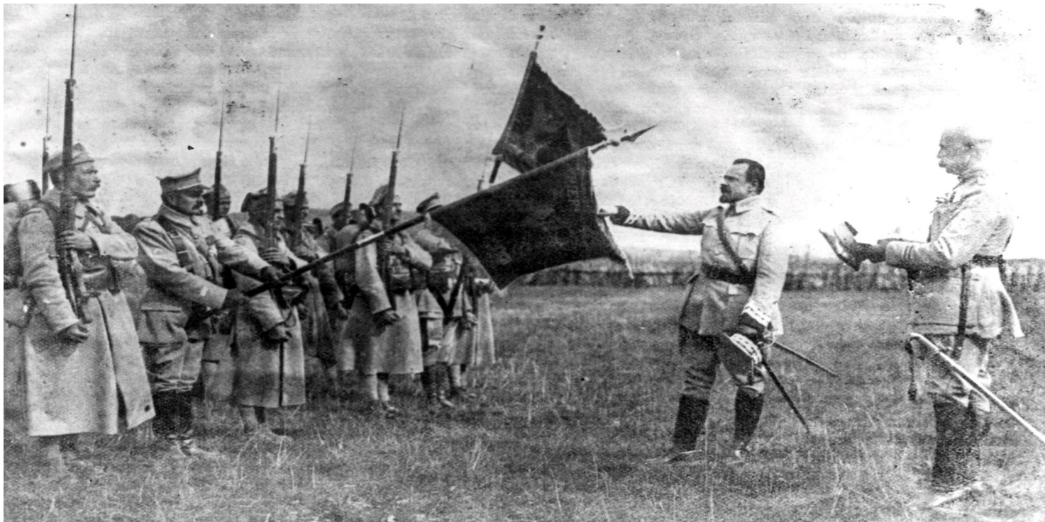
Objęcie przez gen. Józefa Hallera dowództwa nad Armią Polską we Francji, 1918-1939.

https://przystanekhistoria.pl/pa2/tematy/polskie-wojsko/101323,Pod-wylacznie-polskim-dowodztwem-Dekret-powolujacy-Polska-Armie-we-Francji.html