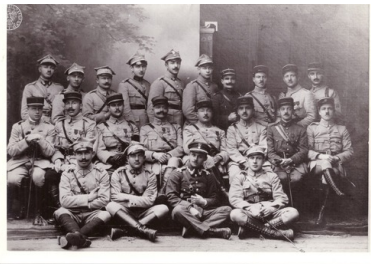
Grupa oficerów polskich i francuskich z Armii Polskiej we Francji, kwiecień 1919 r.

Po zakończeniu działań militarnych na Zachodzie do Armii zaciągnęło się ok. 57 tys. żołnierzy: byli to Polacy z USA oraz emigranci z Kanady i Francji. Później doszli Polacy z przebywających we Francji i ogarniętych fermentem rewolucji dywizji rosyjskich.