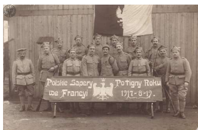
Polscy saperzy w Potigny we Francji, 19 sierpnia 1917 r.

Błękitną Armię (po francusku L'Armée Bleue nazwaną od koloru mundurów) zaczęto formować miesiąc później w obozie Sillé-le-Guillaume (region Loary), a 8 stycznia 1918 r. utworzono dwubatalionowy 1. Pułk Strzelców Polskich. Skład Armii był mozaiką żołnierzy różniących się między sobą pod względem pochodzenia, cenzusu naukowego, świadomości narodowej i doświadczenia bojowego. Oficerami na wyższych i niższych szczeblach byli Francuzi, a także Francuzi polskiego pochodzenia z regularnej armii i Legii Cudzoziemskiej, nieliczni „bajończycy”, oficerowie Polacy z armii rosyjskiej i austriackiej, legioniści, liczna grupa podoficerów Polaków z armii niemieckiej przeszkolona we Francji na oficerów oraz grupa ochotników z „Sokoła” (głównie ze Stanów Zjednoczonych, którzy ukończyli szkoły oficerskie w Kanadzie, a we Francji otrzymali stopnie oficerskie).