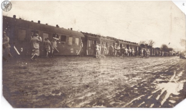
Żołnierze Błękitnej Armii przy i w pociągu zmierzającym do Polski, 1918 r.