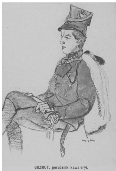
GRZMOT, porucznik kawalerii.