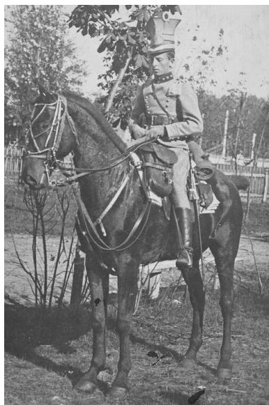
1915 r. Porucznik Stanisław Grzmot-Skotnicki.

U progu wojny znalazł się w Krakowie, gdzie wstąpił do tworzącej się 1. kompanii kadrowej. Nie przypuszczał, że już 2 sierpnia 1914 r. stanie przed zadaniem, które przez samego Józefa Piłsudskiego było określane jako straceńcza misja.